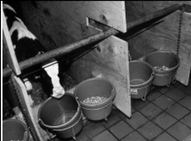
Рисунок 3: Кормление зерновым начальным рационом с высокими вкусовыми качествами и водой обеспечивает быстрое развитие рубца и ранний отъем.

возраста обычно приводит к более высокому уровню смертности. С другой стороны, отъем произведенный позднее восьминедельного возраста приводит к большим затратам по следующим причинам: