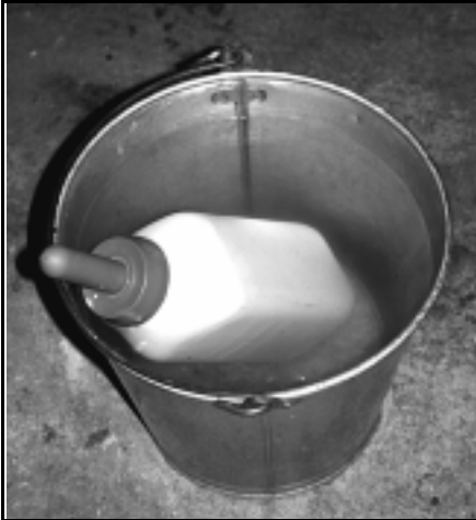
Рисунок 3: Измерение количества молока, скармливаемого через бутылку с соской или ведерко, а также его подогрев до необходимой температуры является важной процедурой в обеспечении хорошего кормления.